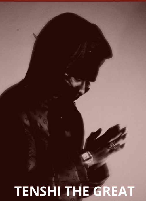
TENSHI THE GREAT